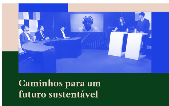
Caminhos para um futuro sustentável

O Conselho Superior de Direito da Federação se manifestou contra a aprovação do PL 752/2021, que aumentará a taxa judiciária recolhida ao TJSP e, conseqüentemente, prejudicará o acesso dos contribuintes ao Tribunal de Justiça de São Paulo. O custo judiciário do Estado paulista é o segundo maior do País!